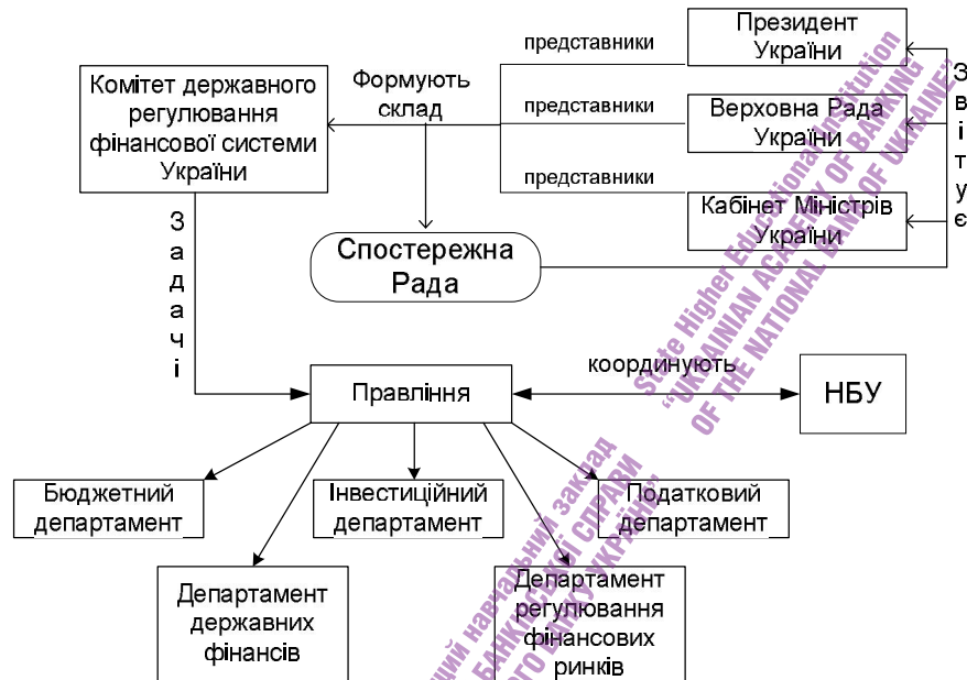
Рис. 3. Структура і взаємодія мегарегулятора фінансової системи України

Одним з ключових питань створення мегарегулятора є його підзвітність. Пропонується розділити повноваження щодо управління і підзвітності мегарегулятора між Кабінетом Міністрів, Верховною Радою і Президентом країни. Мегарегулятор має звітувати в поточному режимі Кабінету Міністрів, періодично – Верховній Раді. Якщо його діяльність визнається незадовільною, то склад правління може бути змінений. Крім того, в поточному режимі мегарегулятор має періодично оприлюднювати звітність про власну діяльність.