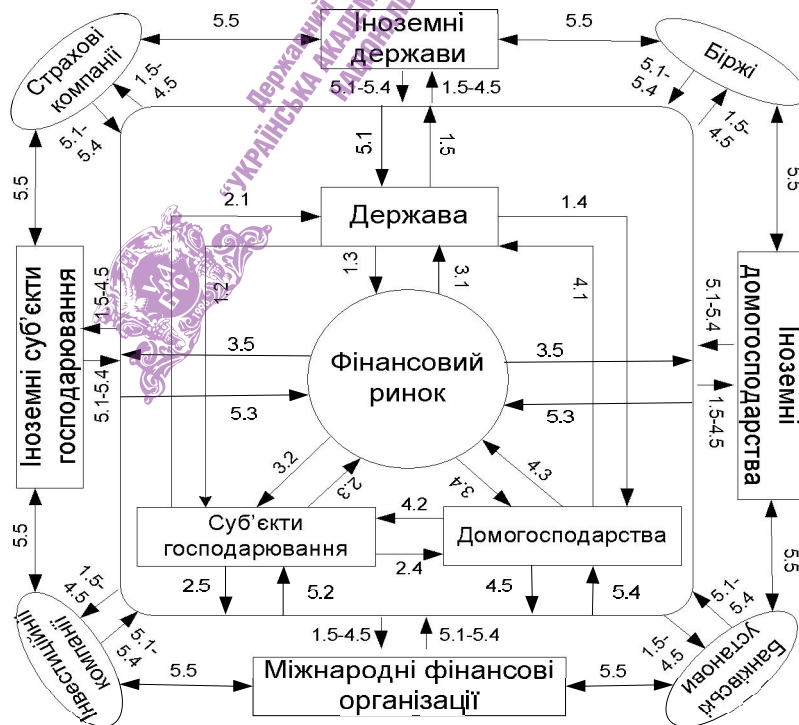
Рис. 2. Структура фінансової системи України

На базі запропонованої матриці використовується методичний підхід до обґрунтування механізму взаємодії суб'єктів фінансової системи, який дає комплексне уявлення про всі фінансові відносини, що виникають між ними в процесі руху фінансових ресурсів (рис. 2). Числові позначення, що використовуються на рис. 2, відповідають певним елементам в матриці фінансових відносин (табл. 3).